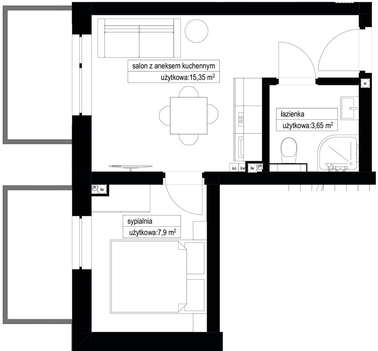
Apartament nr 04